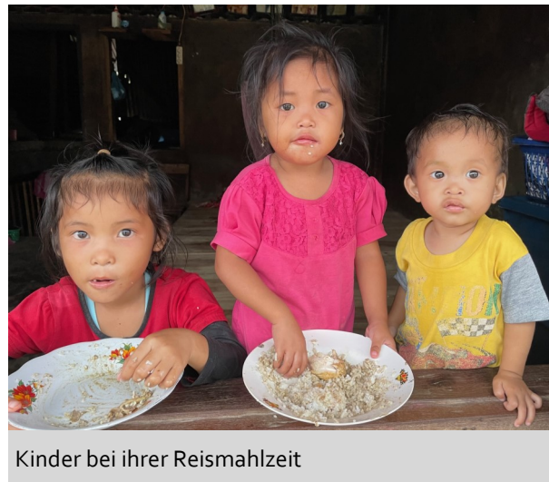
Kinder bei ihrer Reismahlzeit

und Chilischoten, die nur zum Selbstverbrauch auf der Insel bestimmt sind. Die Arbeiter verdienen beim Pflücken der Früchte oder bei der Gartenarbeit zwischen vier und acht Euro am Tag. Viel zu wenig, um ihre großen Familien zu ernähren.