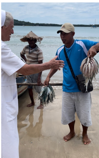
Die Männer sind acht Stunden auf dem Meer, hier ist die Ausbeute einer Tour.

Auf Nias und Tello leben überwiegend arme Bauern und Fischer, die nur das Allernötigste zum Leben haben. Die Bauern besitzen Hühner, Hunde oder Schweine, die zum Verkauf angeboten werden.