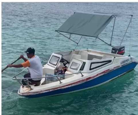
Mit diesem kleinen Boot fahren die Missionare auf die umliegenden Inseln

Auch konnte für das kleine, missionseigene Boot mit vier Sitzplätzen, mit denen die umliegenden Inseln zur Versorgung der Kranken angesteuert werden, ein neuer Motor gekauft werden. Auf meiner Reise im vergangenen Jahr wurde mir nach einer Bootsfahrt berichtet, dass der Motor manchmal ausfällt. Bei stürmischem