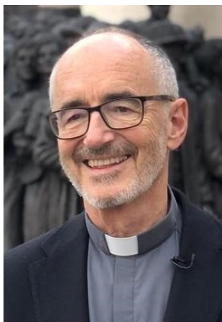
Kurienkardinal Michael Czerny geb. 18. Juli 1946 in Brünn, Tschechoslowakei

Der Kurienkardinal Michael Czerny (77) erhält den Klaus-Hemmerle-Preis 2024.